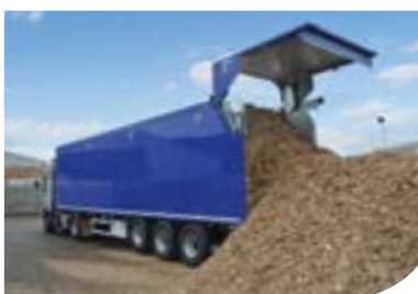
Transport tocătură de lemn / biomasă