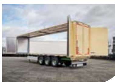
Uși de ambele părți