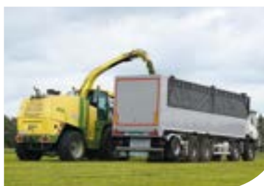
Construcție personalizată pentru agricultură