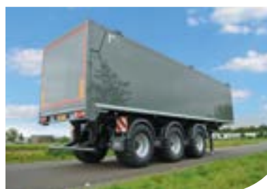
Semiremorci dedicate pentru agricultură