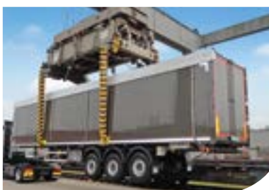
Sistem de ridicare a remorcilor pentru încărcare în vagoane feroviare