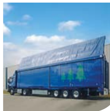
Experiență din 1984