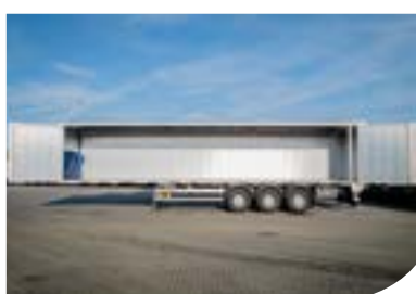
Versiune ușoară - LIGHT