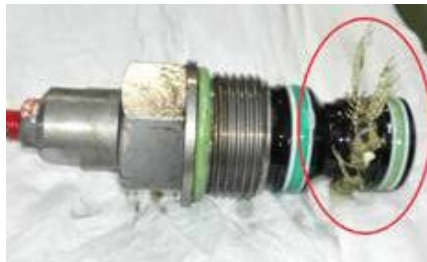
Verunreinigung des Systems

Wenn Sie die Schläuche wieder richtig angeschlossen haben und das Öl daher wieder richtig durch das System läuft, können das Material des defekten Filters sowie bereit vorhandener Schmutz durch das System geleitet werden. Dies führt zu einer Verunreinigung des Ventilblocks, wodurch das Bodensystem nicht mehr funktioniert. Sollte Ihr Schubboden spontan in Betrieb gegangen sein, nachdem die Druck- und die Rücklaufleitung verkehrt angeschlossen waren, müssen Sie immer kontrollieren, ob der Ölfilter noch in Ordnung ist.