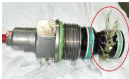
Vervuiling van systeem

Als u de slangen weer op een correcte wijze aangesloten hebt en de olie dus weer op een correcte wijze door het systeem loopt, kan het materiaal van het defecte filter, evenals de reeds aanwezige vervuiling door het systeem gaan. Dit zorgt voor vervuiling van het ventielblok waardoor het vloersysteem niet meer functioneert. Mocht uw schuifvloer spontaan in werking zijn getreden na het verkeerd aansluiten van de pers- en retourleiding, controleer dan altijd of het oliefilter nog in orde is.