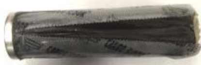
Op bovenstaande foto's is het filterhuis geëxplodeerd.