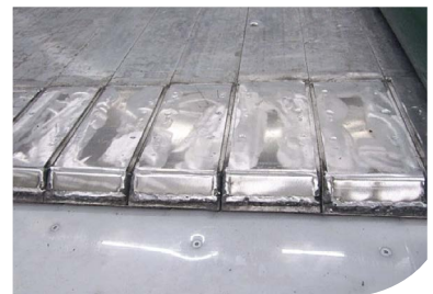
Plaques de protection en aluminium