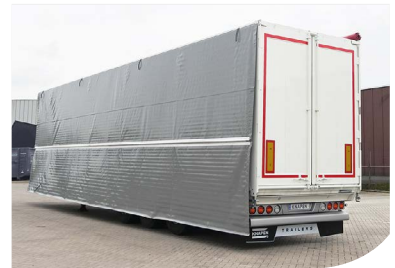
Bâche latérale de protection