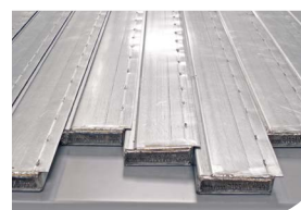
Fond en acier plat X