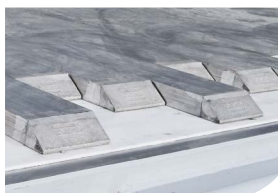
Aluminium de 10 mm

Depuis 1984, toute notre attention se porte sur l'amélioration continue d'un seul produit : la semi-remorque à fond mouvant. Ce type de semi-remorque a fait ses preuves, entre autres, dans le secteur des déchets en tant que moyen de transport intelligemment utilisable. Nous appelons notre nouvelle génération NEXT . Cette génération a été complètement soudée par robot, testée au niveau robustesse et créée sur la base de plus de 34 ans d'expérience. De cette manière, nous assurons à nos clients des années d'utilisation sans problème, les coûts totaux les plus bas et une valeur résiduelle la plus élevée qui soit. En repoussant les limites, nous avons créé une longueur d'avance dans notre secteur, depuis plus de 34 ans. Nous en sommes fiers et nos clients peuvent compter sur nous.