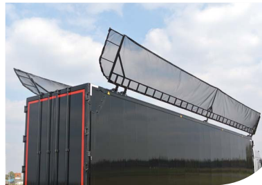
Toit pliant hydraulique