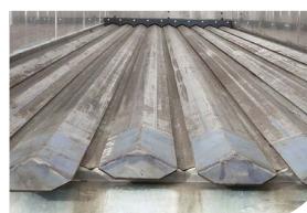
Fond en V acier