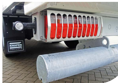
Éclairage bien protégé