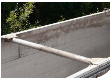
Structure à tablier Heavy Duty