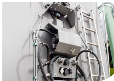
Système de tablier / Tablier à rétraction (hydraulique)