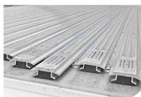
Fond en V aluminium