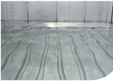
(Semi) Leak proof