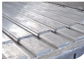
(Semi) Leak proof