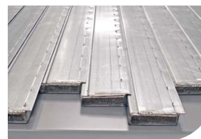
Flat Steel X Floor