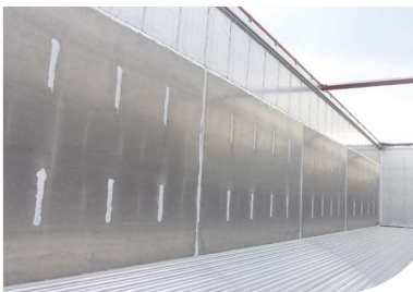
Schleißplatten in allen erdenklichen Arten und Größen