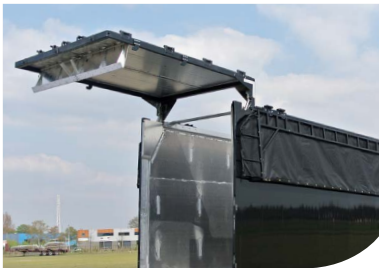
hydraulische Heckklappe (optional mit integrierten Türen)