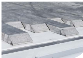
10 mm Aluminium

Seit 1984 richten wir unsere gesamte Aufmerksamkeit auf die kontinuierliche Verbesserung eines einzigen Produkts: des Schubbodenauflegers. Dieser Aufliedertyp hat sich u. a. im Abfallsektor als intelligent einsetzbares Transportmittel bewährt. Unsere neueste Generation nennen wir NEXT . Diese Generation ist vollständig robotergeschweißt, wurde ausführlich getestet und basiert auf nicht weniger als 34 Jahren Erfahrung. So garantieren wir unseren Kunden einen jahrelangen problemlosen Gebrauch, die niedrigsten Gesamtkosten und den höchsten Restwert. Wir verschieben die Grenzen und erreichen so schon seit 34 Jahren einen Vorsprung in unserer Branche. Dafür stehen wir und unsere Kunden dürfen das in jeder Hinsicht von uns erwarten.