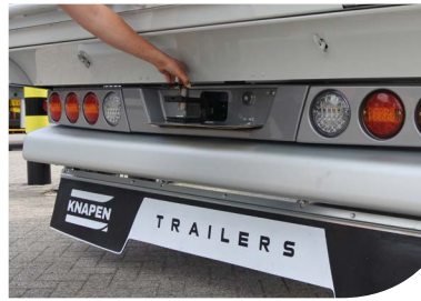
robuste Abschleppöse in der Mitte